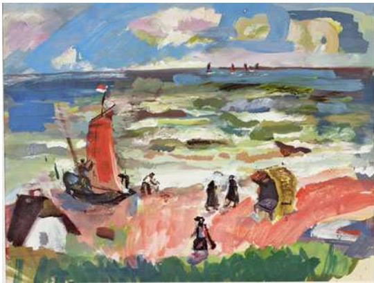
Kat. 47. Ostseestrand, 1929–31, 43 x 58 cm