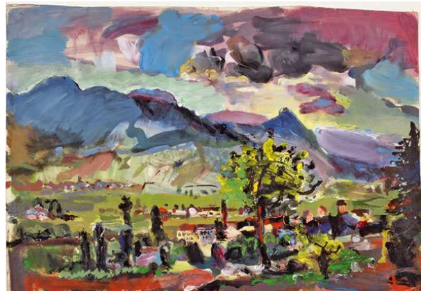
Kat. 65. Türkheim im Elsass, 1934, 38 x 50 cm