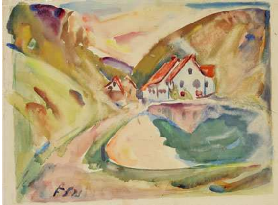
Kat. 11. Altdorf im Tal am Weiher, 1921, 35 x 25 cm