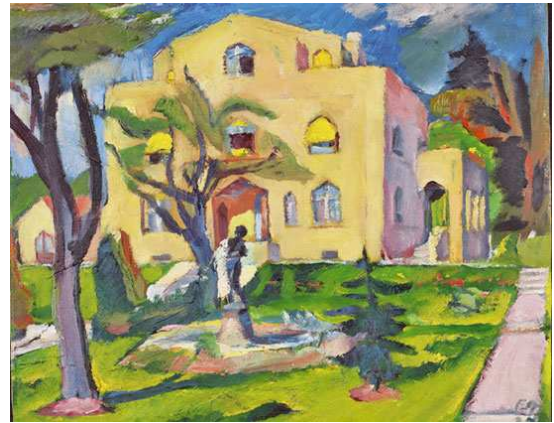
Kat. 17. Haus mit Garten in Böblingen, 1924, 48 x 58 cm