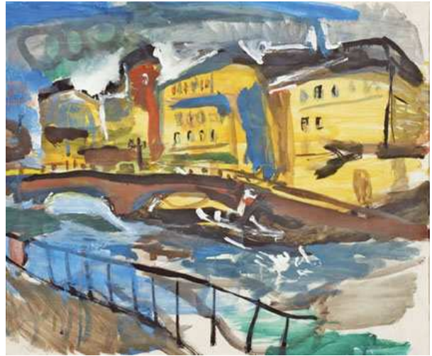
Kat. 36. Häuser an der Spree, 1929–31, 52 x 63 cm