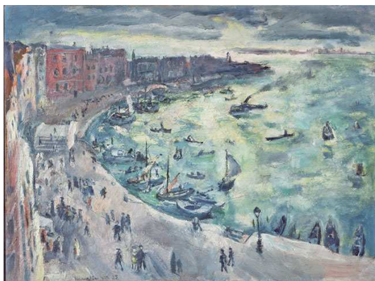
Kat. 28. Venedig, 1925, 75 x 100 cm