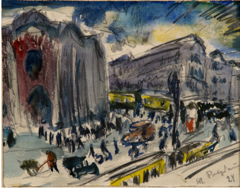
Kat. 20. Berlin. Potsdamer Platz, 1924, 15 x 23 cm