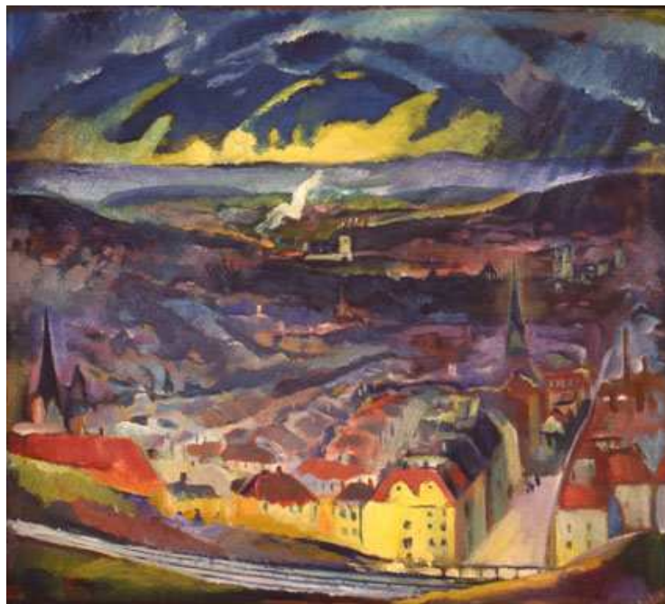
Kat. 19. Stuttgart. Blick vom Hasenberg, 1924, 105 x 114 cm