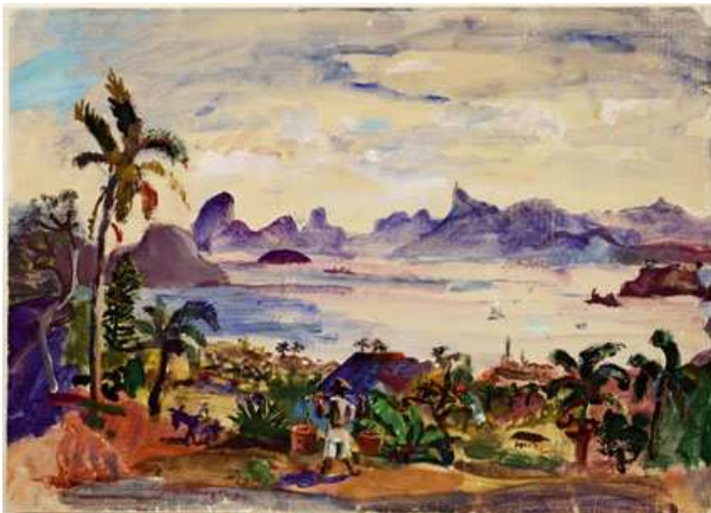
Kat. 70. Meeresbucht mit Bergkette bei Rio, 1934, 45 x 63 cm