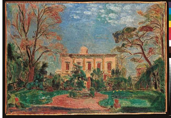
Hans Purrmann (1880-1966): Villa Romana, 1938, Privatbesitz

Wunder unter vielen anderen. Zweimal wurde sie im Zusammenhang mit den beiden Weltkriegen beschlagnahmt. Denn, obwohl sie 1915 vorsorglich dem italienischen Rotes Kreuz abgegeben worden war, wurde sie trotzdem 1921 enteignet und erst 1926 völlig heruntergekommen wieder zurückgewonnen, u.a. auch durch einen Bittbrief an Mussolini (Wiedereröffnung 1929). Sie wurde nochmals 1943/44 geräumt und 1945 beschlagnahmt und konnte nach großen Anstrengungen erst 1958 wieder gegründet werden. Maßgeblich dafür waren dann Hans Marsilius Purrmann und Bundespräsident Theodor Heuss, der die Villa Romana durch Besuche 1909 und 1939 kannte.